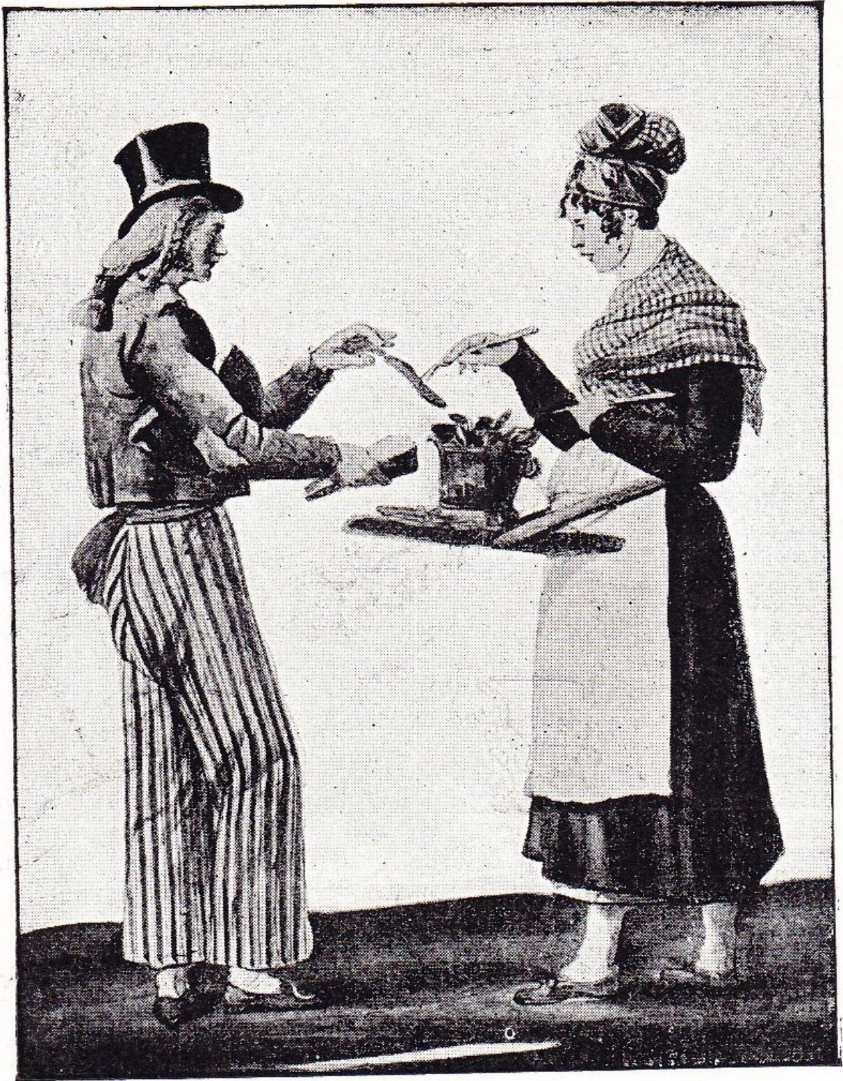
LES PETITS MÉTIERS DE PARIS. La marchande de saucisses, par CARLE VERNET. (Bibliothèque de la Ville de Paris.)